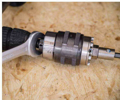
Den TORQUE LIMITER auf den richtigen Drehmomentwert einstellen.