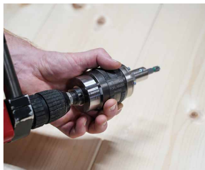
Die äußere Einschraubhülse drehen, um den TORQUE LIMITER zurückzusetzen.