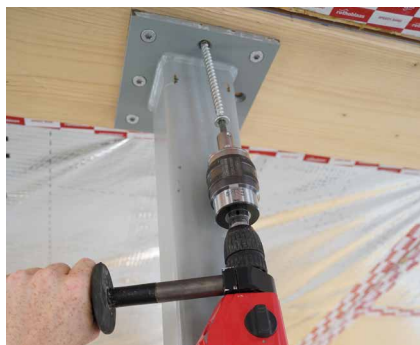
Beim Eindrehen rastet der TORQUE LIMITER beim eingestellten Drehmomentwert aus.