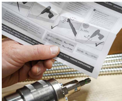
Den für die Schraube vorgesehenen Drehmoment-Grenzwert genau überprüfen.

Vor der Verwendung die Betriebsanleitung des TORQUE LIMITER lesen. Diese befindet sich im Lieferumfang des Produkts und ist auf www.rothoblaas.de erhältlich.