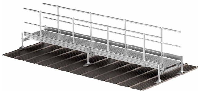
PASARELAS PARA FIJACIÓN A CHAPA TRAPEZOIDAL