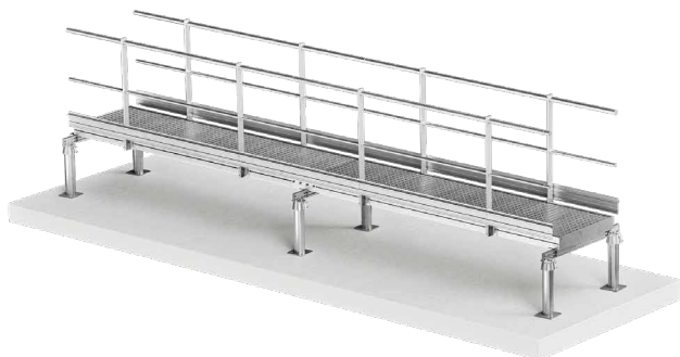
PASSERELLE FISSAGGIO ORIZZONTALE E INCLINATO