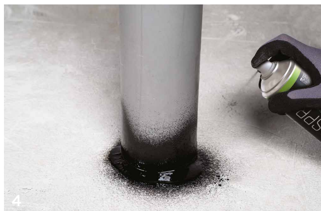
1 BYTUM REINFORCEMENT